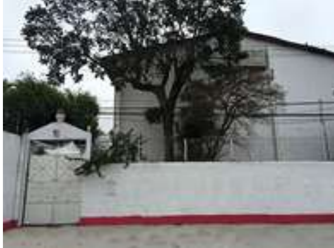
Imagem e 2 Vista frontal do Axé com sua escada de entrada.

Fonte: Imagem 3 - https://pt.wikipedia.org/wiki/Ax%C3%A9_Il%C3%AA_Ob%C3%A1