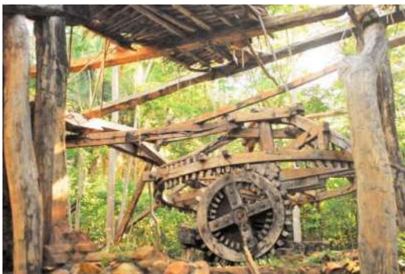
Figura 3: Engenho do Sítio Fundão