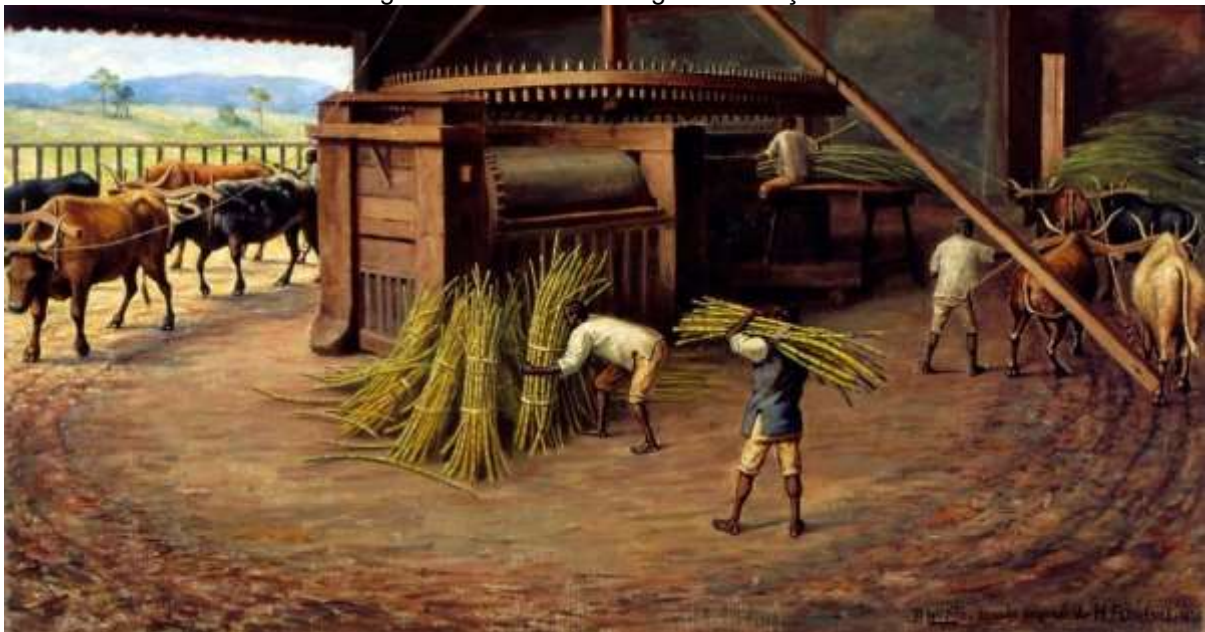
Figura 1: Trabalho no Engenho de Açúcar

O olhar geográfico sobre a composição material e o funcionamento social nos engenhos precisa ser ampliado, ultrapassando a visão equivocada de que as populações africanas e afrodescendentes possuíam apenas a força braçal para manutenção da produção açucareira no contexto econômico brasileiro. Professoras e professores, especialmente de geografia, precisam problematizar junto aos estudantes, a existência do pensamento complexo das populações tradicionais, desmistificando a ideia de incivilidade social. Na figura 1, apresentamos alguns pontos importantes que podem ser debatidos entre professoras/es e alunas/os no intuito de superar os ideários baseados na inércia social negra.