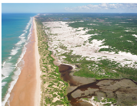
Figura 2 - Sistema de Dunas e Restingas

Espaço “natural” é compreendido, não como natureza intocada a ser preservada (SMITH, 1988), e sim como parte integrante do espaço, portanto produto social, corroborando com a idéia de que “tudo que existe na terra é atualmente influenciado pela atividade humana” (LIPIETZ, 1995, apud LIMONAD, 2004, p.2). Conforme Limonad “[...] discursos sobre a natureza, [...] apesar de serem proposições ecológicas não deixam de ter um caráter social, político e geográfico – na medida em que conjugam interesses geograficamente localizados” (LIMONAD, 2004, p. 6).