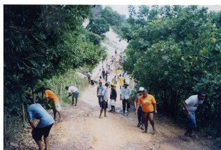
Figura 6 – Movimento dos moradores Fonte: acervo AMAM 2005

Assim como no caso da Barreto de Araújo, empresa imobiliária que, na década de 1970, provocou o deslocamento da comunidade de Entrada, esta outra empresa tenta garantir a posse dessa mesma área à revelia dos posseiros, considerados por muitos, como sendo os verdadeiros donos. Dos pesquisados, 60% declaram ter participado diretamente de todo o processo e 40% não (ver Tabela 1). Os depoimentos se repetem, o movimento era pra “liberar o acesso, a estrada”, “derrubar as cercas da PACAB”.