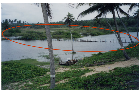
Figura 5 – Cerca impedindo acesso

O conflito mais recente registrado na área de estudo diz respeito ao cerceamento do acesso, inicialmente pela empresa PACAB Brasil que, no ano de 2002, arremata as terras em leilão público. A empresa cerca a área que compreende ser de sua propriedade e causa o estreitamento da estrada, única via de acesso da localidade à praia e a outros espaços utilizados há mais de três décadas pelos moradores. A PACAB passa a ser representada pela Entre Rios Villas e Resorts , empresa portuguesa e, em 2005 os conflitos continuam, cercando-se, o brejo e a duna. A Comunidade amplia o movimento e derruba os obstáculos para defender seu direito ao livre acesso (ver Figuras 5 e 6).