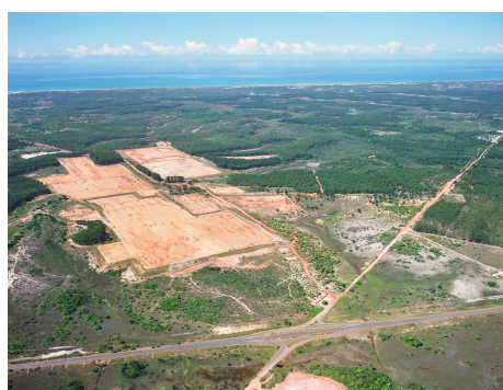
Figura 3 - Área da fábrica da Norcel

Valorizada pelo capital, na medida em que é apropriada por diferentes grupos econômicos desde o período colonial, a área em questão mantém-se sem conflito aparente com a sua conservação “natural” e com a comunidade local até a década de 1970. A partir daí, diversos conflitos de interesses se manifestam entre grupos sociais externos que se apropriam das áreas mais cobiçadas, próximas ao mar, e grupos sociais internos que usam a terra para seu sustento e reprodução e são deslocados por novas funções e por ações regulatórias promovidas pelo Estado. Nessa união vertical, os vetores de modernização “[...] trazem desordem aos subespaços em que se instalam e a ordem que criam é em seu próprio benefício” (SANTOS, 1996, p.228).