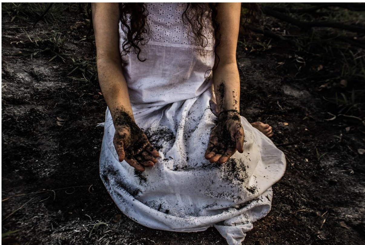
Figura 2 Sem título, Série Queimadas, Assis-SP, 2017

Outro signo importante que tento trazer nas imagens é das cinzas. Sempre pensei que não basta a crítica, não basta o lamento, não basta escancarar tais violências. Precisamos criar alternativas, práticas de resistência, modos de lutar contra.