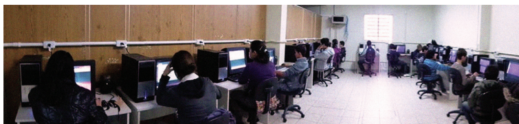
Figura 2 – Encontro para inclusão digital de adolescentes.

Os encontros que correspondiam à inclusão digital eram do curso de Informática Básica. Nele, semestralmente 30 adolescentes participavam dos encontros com o objetivo de construir conhecimento sobre as tecnologias de informação e comunicação. Estruturalmente, vale destaque à relação entre o número de educandos e o número de computadores (27 alunos para 19 computadores), relação que obrigava a formação de duplas de trabalho, o que, segundo o professor, potencializava conversas paralelas, resultados também encontrados nos estudos de Menezes (2006) e Marcon (2011). Característico de uma turma de adolescentes, os educandos eram bastante agitados. Na tentativa de controlar as conversas paralelas e dar suporte ao aprendizado, o professor escolheu duas monitoras e promoveu a eleição de uma líder. As monitoras auxiliavam os colegas na realização das tarefas e a líder era uma ponte entre educandos e educador. A Figura 2 ilustra um encontro.