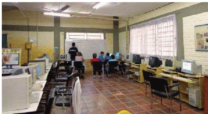
Figura 3 – Encontro para inclusão digital de idosos.

Os educandos tinham uma relação afetuosa entre si. No início da aula, conforme as alunas chegavam, cumprimentavam-se com abraços e beijos no rosto. Esse tratamento se estendia a mim, ao professor e às voluntárias. Aquelas que tinham um laço de amizade já consolidado ou um assunto em comum, procuravam sentar-se próximas, usar computadores vizinhos ou formarem duplas usando o mesmo computador. Do ponto de vista de Freedman, Carlsmith e Sears (1970), o projeto proporcionou aos idosos o processo de socialização, coerente ao ambiente em que eles se propuseram estar – ambiente escolar. A Figura 3 ilustra um encontro.