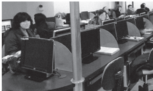
Figura 1 – Encontro para inclusão digital de jovens e adultos.