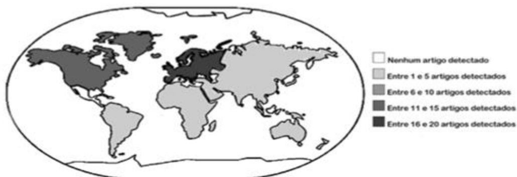
Figura 2. Quantidades de publicações distribuídas por continentes

Identificou-se uma expressiva distribuição geográfica das publicações (Figura 2), sendo grande parte delas oriundas da Europa (com vinte publicações no total, sendo uma delas uma parceria entre Canadá e Reino Unido) e da América do Norte (com doze publicações no total, sendo uma delas uma parceria entre Canadá e Reino Unido), tendo menor representatividade na América do Sul (quatro), África (três), Oceania (um) e Ásia (um). Não houve publicações da América Central e da Antártida. Dois artigos não explicitaram suas localizações. Por fim, o idioma que contemplou o maior número de publicações foi o inglês, presente em cerca de 90% dos artigos analisados.