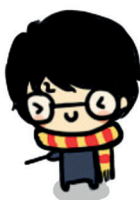
Figura 3 – I love Harry Potter.