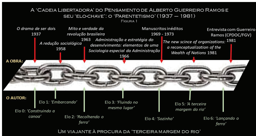
Figura 1. A cadeia de ideias do pensamento de Guerreiro Ramos e seu ‘elo-chave’: o ‘parentetismo’ (1937-81)