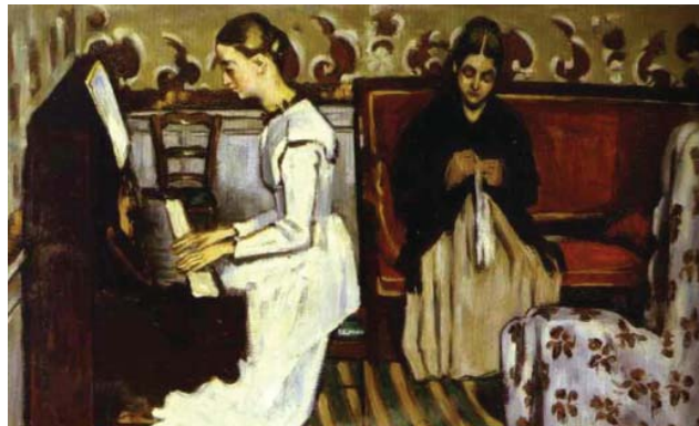
Figura 2. Paul Cézanne. Menina ao Piano , 1869-1870. Óleo sobre tela, 57 x 92 cm. Museu do Ermitage, São Petersburgo.

A fase de Cézanne que alterna realismo e imaginação romântica, por outro lado, está longe de representar a sua produção mais significativa. Ela representa mesmo uma fase em que o pintor ainda buscava um estilo pessoal que o singularizasse na constelação de pintores parisienses. Trata-se, poder-se-ia dizer, de uma fase de aprendizado paciente e autodidata, que logo iria lhe render novos frutos. Pode ser apontado como um marco decisivo para uma nova fase na produção pictórica de Cézanne o ano de 1870, em virtude de fatos que incluem uma retirada de Cézanne para sua região natal – Aix-em-Provence –