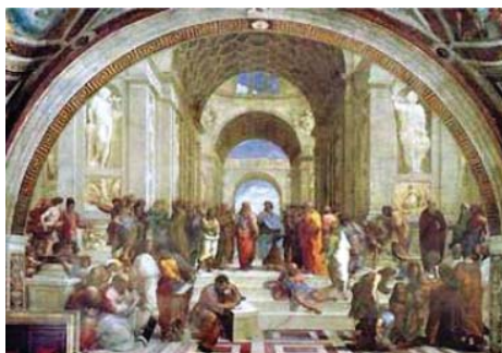
Figura 5. Rafael. A Escola de Atenas , 1510-11. Afresco. Stanza della Segnatura, Palácio Vaticano, Roma.

A Perspectiva propriamente dita baseia-se na consideração de um ponto de fuga e no cálculo do tamanho exato que deveriam ter as figuras de uma cena para refletir a sua distância, considerando que à medida que os objetos se afastam do observador eles diminuem de tamanho. Existem, contudo, uma