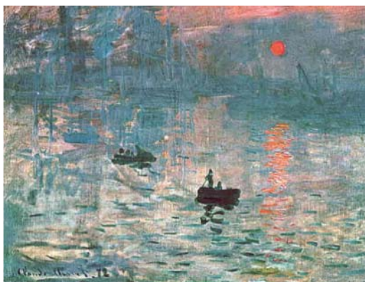
Figura 6. Claude Monet. Impressões: Sol Nascente , 1872. Óleo sobre tela.

o olhar. As abordagens clássicas e neoclássicas, desta maneira, trabalham no sentido de iludir o observador, de modo que ele se esqueça que o que tem diante de si é apenas uma tela coberta de traços e cores. 2