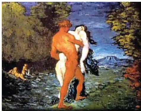
Figura 1. Paul Cézanne. O Rapto , 1867. Óleo sobre tela

Essa periodização é apenas uma referência inicial para nos situarmos, e não será preciso insistir nela senão para evocar a temporalidade sobre a qual Cézanne produz a sua obra. De saída, a primeira fase produtiva de Cézanne – que aqui situaremos entre os primeiros anos em que assume definitivamente o seu projeto de se tornar pintor e o ano de 1870 – é bastante complexa e de difícil caracterização. Ao mesmo tempo em que o pintor luta frontalmente contra a tradição acadêmica, ele também luta para encontrar o seu estilo. Nesta busca inicial de um estilo, aparecem entre os anos de 1867 e 1868 temas intensos e de caráter por vezes violento, como os quadros O Rapto (1867) e O Homicídio (1867-1868). O filósofo Merleau-Ponty chama aos quadros pintados por Cézanne nesta fase de “sonhos pintados” (MERLEAU-PONTY, 1975, p. 304), e tem motivos bem justificados para utilizar tal expressão. De fato, o que habitualmente motiva e move os pincéis de Cézanne nesta época é a possibilidade de imprimir na tela os seus sentimentos, de criar expressivamente em torno de referências literárias bem definidas, de narrar situações através da pintura.