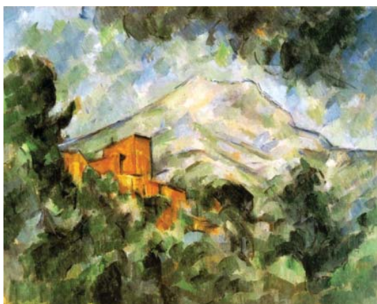
Figura 8. The Château-Noir and Mont Sainte-Victoire , 1904-1906. Óleo sobre tela. 51 x 61 cm.

Já mencionamos antes o fato de que a maneira de perceber imagens na vida em curso é bem distinta daquilo que se pode obter das imagens de objetos reais através de um quadro perspectivado geometricamente à maneira dos clássicos, ou mesmo através de uma fotografia que imobiliza as imagens em um quadrado de papel fixo e de dimensões pequenas. A fotografia ou um quadro pintado de acordo com a perspectiva geométrica não correspondem nem um nem outro aos efeitos que ocorrem sobre a visão durante um ato perceptivo inserido na realidade cotidiana. O olho humano, quando observa objetos, não traça simplesmente uma perspectiva, e muito menos imobiliza imagens de maneira fixa. Ele habitualmente contorna os objetos que observa, desloca-se em torno dele, adivinha a sua dimensão tátil. Quando o olho percorre uma superfície mais ou menos extensa, as imagens obtidas são sucessivamente tomadas de diferentes pontos de vista, acumulando em um movimento espontâneo deformações diversas umas sobre outras (MERLEAU-PONTY, 1975, p. 307).