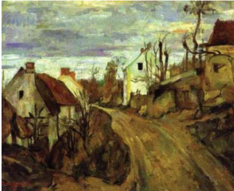
Figura 7. Cézanne. Village Road, Auvers . c.1872-73. Óleo sobre tela.

numa direção contrária à do mero resgate das cores locais, pois eles queriam se valer precisamente dos fenômenos de contraste que no mundo natural modificam as cores locais.