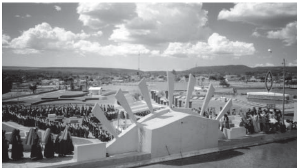
Figura 2 - Imagem do templo de Brasília.

sagrado copiado e repetido depois indefinidamente na construção de todos os novos altares, de todos os novos templos ou santuários (ELIADE, 2002, p. 299)