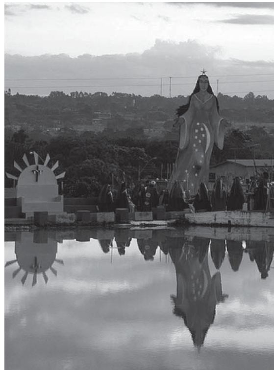
Figura 5 - Imagem do templo de Brasília.

Ainda acerca de tal símbolo destacamos que o Pai Seta Branca não possui apenas os símbolos de ascensão e espetaculares em sua construção, como também os símbolos da divisão, uma vez que a flecha que o mesmo carrega em suas mãos pode ser entendido também como a arma do herói, é um símbolo de pureza, que permite ao mesmo a transcendência que “(...) está sempre, portanto, armada , e já encontramos esta arma transcendente por excelência que é a flecha, e já tínhamos reconhecido que o cetro de justiça traz a fulgurância dos raios e o executivo do gládio ou do machado.” (DURAND, 2002, p. 159).