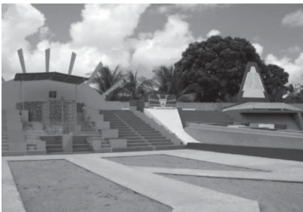
Figura 3 - Imagem do templo de Olinda.