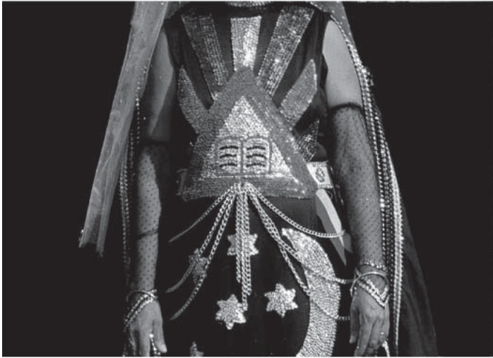
Figura 1 - MEDIUM Apara no Vale do Amanhecer em Brasília/ (Fonte: Batista, 2003).