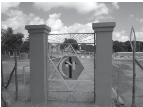
Figura 4 - Imagem portão de entrada do templo de Olinda - PE.

Por isso que encontramos uma repetição em termos de organização espacial e de construção estilísticas dos templos de Brasília e de Olinda, por exemplo, na medida em que devem obedecer não a preceitos “profanos”, mas sim “sagrados”.