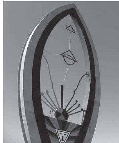
Figura 7 - Imagem do VDA de Brasília.

Além do mais, apesar de que não há no VDA preocupações apocalípticas (MELLO, 1999), há na narrativa mítica do movimento a idéia de que a humanidade possui origens num planeta chamado “Capela”, do qual também proveio o Pai Seta Branca, e ao qual toda a humanidade retornará. Nesta narrativa encontramos, portanto, a idéia ciclica de tempo, de retorno ao princípio, portanto, neste momento a estrutura sintética do regime noturno mostra a reconciliação com o tempo, que no fim das contas seria a maior imagem da morte que se coloca ante ao homem. O tempo ciclico é, desse modo, a reconciliação com os medos fundamentais do homem, neste caso organizado através do mito que “(...) é feito da pregnância simbólica dos símbolos que põe em narrativa: arquetipos ou símbolos profundos, ou então, sintemas anedóticos” (DURAND, 1996, p. 85)