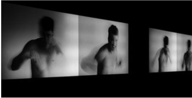
Figura 4: Danilo Barata – Soco na Imagem (Fonte: http://www.danillobarata.com/index.php?option=com_content&view=article&id=2&Itemid=5 ).

A imagem não é mais uma mera cópia do objeto dito real. Ela expressa o rompimento e a apropriação simultânea do corpo que só existe como imagem. Não por acaso a técnica usada é o looping , que permite ao artista sair e retornar para a frente da câmera, num embate que não tem fim.