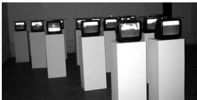
Figura 2: Danillo Barata – O corpo como inscrição de acontecimentos.

Esse corpo inacabado (SANT'ANNA, 2001), considerado como um objeto sempre disponível a reformas, deve aumentar os seus níveis performáticos. Para vencer os perigos crescentes de tornar-se obsoleto, o corpo deve ser continuamente turbinado para acompanhar a sofisticação das máquinas, atender as novas demandas de prazer e liberdade próprios da atualidade.