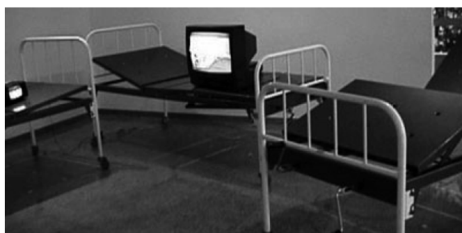
Figura 1: Danillo Barata – Passarela (Fonte: http://www.danillobarata.com/index.php?option=com_content&view=article&id=2&Itemid=5 ).

Em Passarela , Danillo Barata denuncia esse vazio. O artista constrói esse trabalho utilizando seis macas, em cima das quais estão diversos televisores, exibindo vídeos com desfile de moda, onde corpos supostamente perfeitos ocupam as passarelas e se impõem às pessoas. Curiosamente, também nesses vídeos outras passarelas, longe de qualquer glamour , expõem a evidência de um cotidiano onde tantos corpos desfilam suas interdições, mutilações, imperfeições várias. Essas anatomias depreciadas, esse corpos marginalizados, escamoteados, traduzem outras facetas da corporalidade.