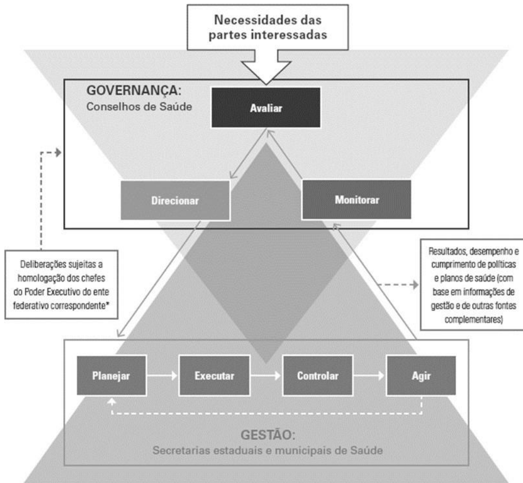
Figura 1: Relação governança organizacional e gestão públicas em saúde no conselho-secretarias de saúde Fonte: Guia de governança e gestão em saúde: aplicável a secretarias e conselhos de saúde (União, 2021b