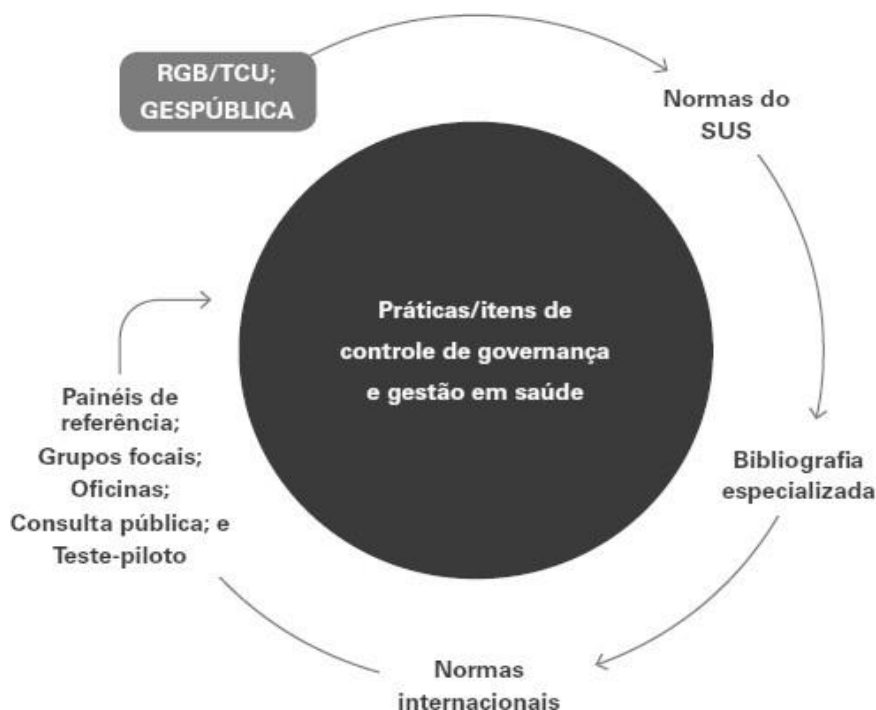
Figura 2: Construção das práticas/itens de controle de governança e gestão em saúde