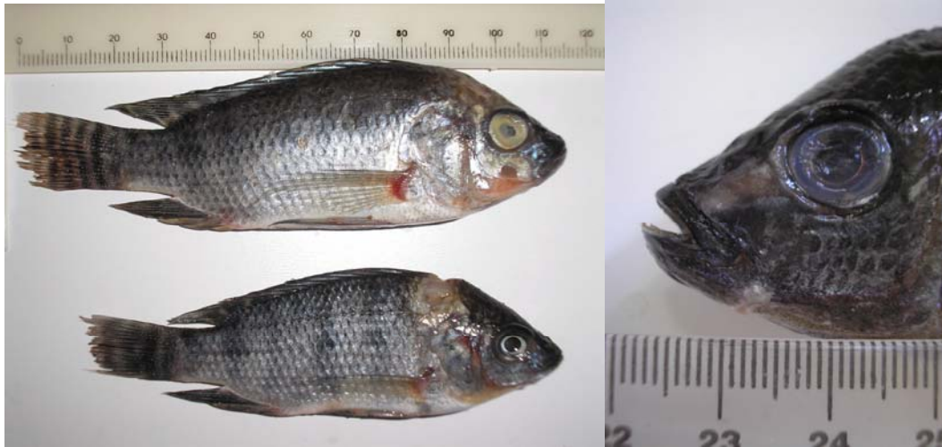
Fig 2. Lesões com exposição da musculatura na cabeça e corpo (→), áreas hemorrágicas(→) e opacidade de córnea (→).

Os peixes estavam alojados em alta densidade, apresentando diferentes faixas de peso, sendo que a alimentação artificial oferecida não era de boa qualidade e de frequência inconstante. O tanque estava coberto por macrófitas aquáticas, com grande quantidade de lodo no fundo, apresentando concentração de oxigênio de 4,0mg/L, pH 5,0, temperatura de 25°C, amônia total de 0,5mg/L e condutividade de 0,20mS/cm.