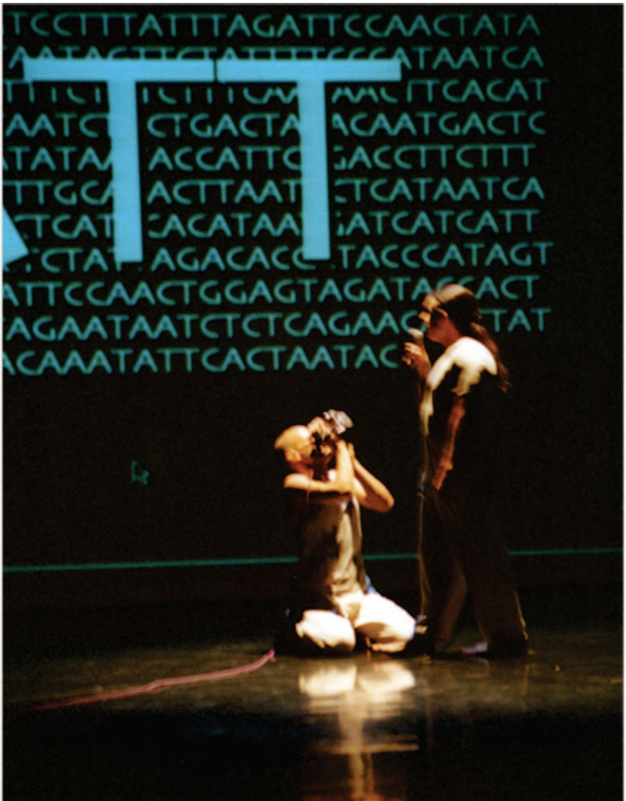
Figura 2. Cellbytes - ACTG