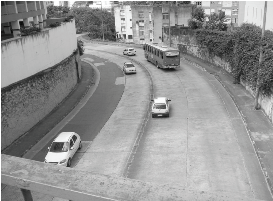
Figura 5 VIADUTO DO LARGO DA GRAÇA, SALVADOR-BA

Na Figura 5, a Praça Dr. Paterson “rasgada” pelo viaduto escavado para ligar o bairro da Graça ao Vale do Canela, o que tornou a pequena praça ainda menor. Até quando será mantida e fora do alcance da especulação imobiliária? Fica a questão.