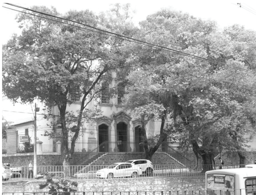
Figura 3 IGREJA NOSSA SENHORA DA GRAÇA, EM SALVADOR-BA

A Igreja esconde-se por trás das árvores. Subo a escadaria com o aluno Leonardo. O interior está vazio. No chão, antes do altar, uma laje com os dizeres: “sepultura de D. Catharina Alvares Paraguassu”. Ao fundo do claustro – decorado com enormes tachos de barro deitados – pode-se ver um arranha-céu. Procuo ver a essência e os significados do lugar, a partir das edificações e demais estruturas existentes (seu patrimônio), complexo no qual coexistem sua materialidade, os significados culturais, os valores estéticos e a memória.