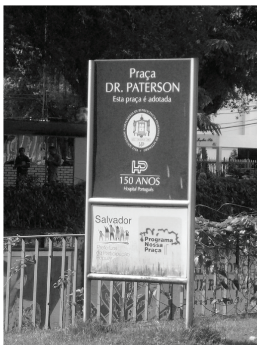
Figura 2 PRAÇA DR. PATERSON, NO LARGO DA GRAÇA, SALVADOR-BA

A Praça, ao centro do Largo da Graça estendendo-se até um canteiro próximo à Perini, foi adotada pelo Hospital Português em outubro de 2006, dentro do Programa Municipal de Adoção de Praças, Áreas Verdes, Monumentos e Espaços Livres de Salvador, lançado pela Prefeitura em abril de 1997, que permite às empresas privadas recuperar e manter logradouros públicos, mesmo considerando que tal adoção lhes serve como um veículo de marketing (Figura 2).