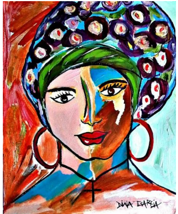
Mulher Africana – 2013