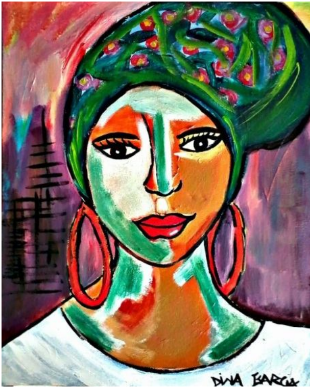
Turbante com flores – 2013