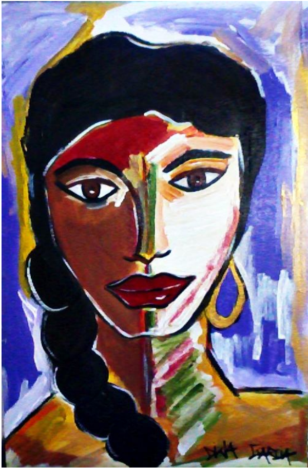
Qual sua face? – 2013