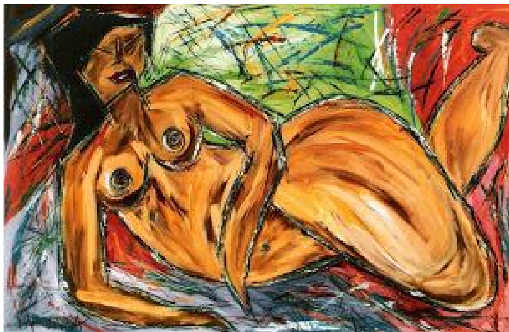
Sedução – 2008