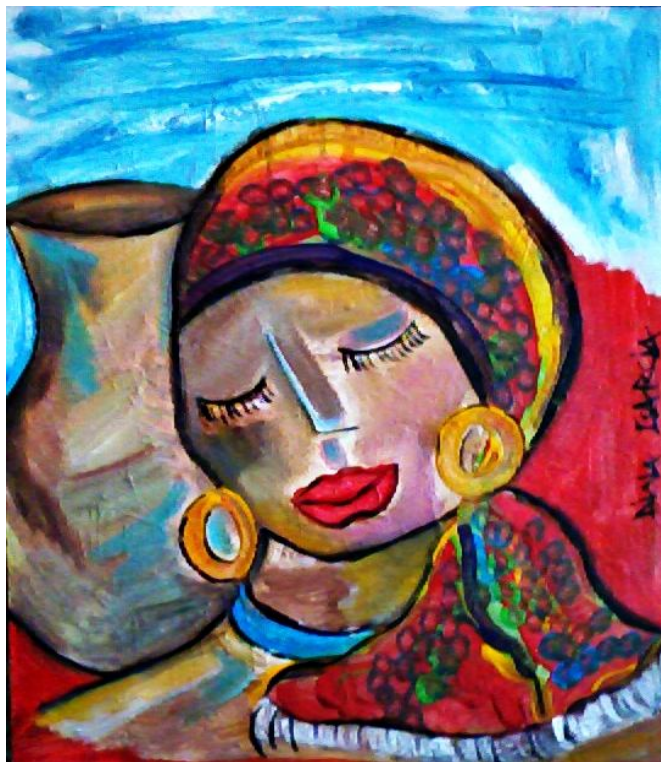
Série Africanas – 2013