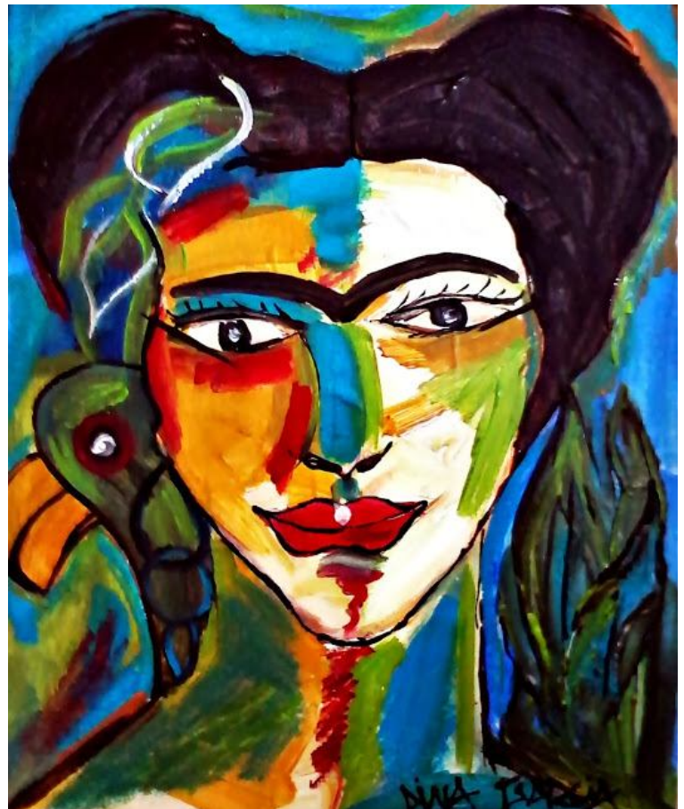
Frida estilizada – 2013