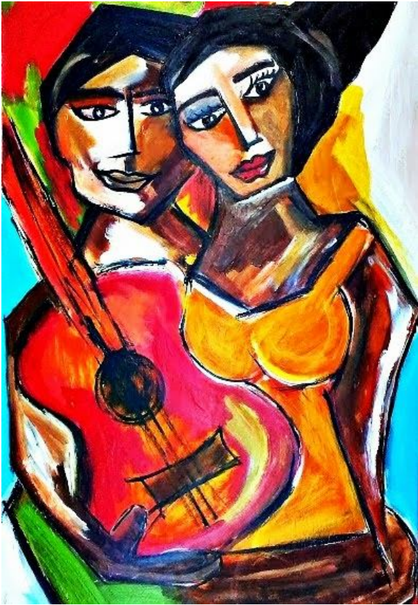
Harmonia e Ritmo – 2013