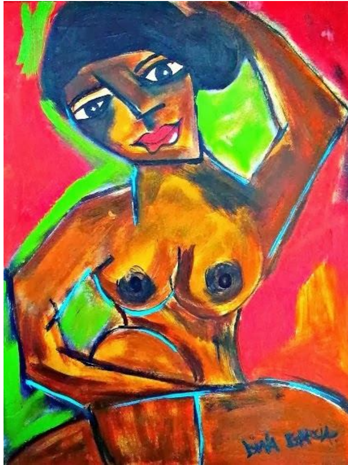
Escultura Humana – 2013