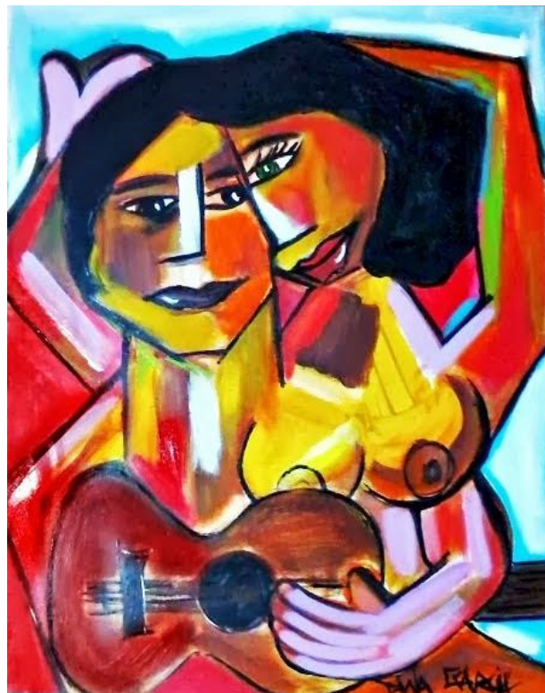
Melodia – 2013