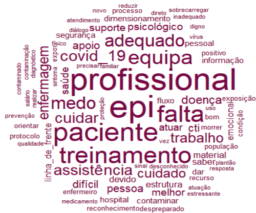
Figura 1 – Nuvem de Palavras