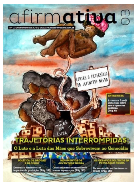
Figura 2: Capa da 3ª edição da Revista Afirmativa