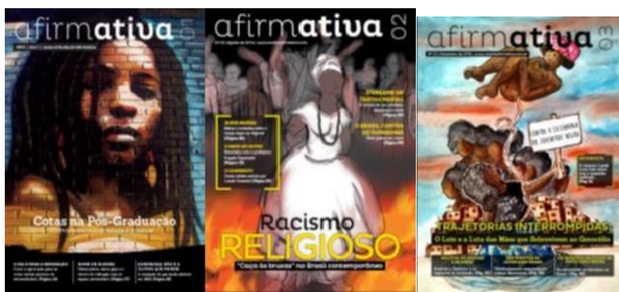
Figura 1: Mosaico com as capas das 03 edições impressas da Revista Afirmativa