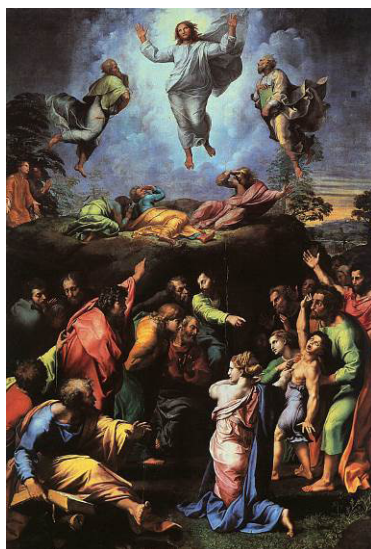
Figura 3: Rafael, A Transfiguração , 1520

Quanto aos estilos, o ponto de partida é o estudo sobre A transfiguração (1520), de Rafael (MAGNO, 2006, p. 187-209). Como se sabe, o quadro é dividido em duas partes. Em cima, a transfiguração de Jesus; embaixo, Jesus cura um menino lunático, possuído, mudo. Ambas retratam cenas descritas por Marcos e Mateus no Novo Testamento. Em cima, só homens, hierarquicamente ordenados: Jesus resplandecente no centro, e os demais ao seu redor. Embaixo, homens e mulheres misturados: de um lado, o grupo de Jesus (este, apontando para cima), com Maria Madalena; de outro, o grupo ligado ao menino (pai, mãe etc.); entre os dois lados, uma enigmática figura de mulher, com os braços, faz um movimento como que de passagem de um a outro grupo.