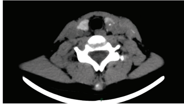
Figura 1 – TC de pescoço sem contraste: glândula tireoide de forma, contornos, dimensões e coeficientes normais, observando-se imagem nodular hipoatenuante, hipocaptante, delineando pequena calcificação e permeio, medindo 1,3 cm em seu maior eixo no terço superior do lobo esquerdo.

Em agosto de 2018, uma garota de 11 anos foi referenciada à Clínica IT – Endocrinologia Especializada Ltda., na cidade de Salvador/BA. Encaminhada pelo endocrinologista responsável a um Serviço de Bioimagem, submeteu-se a exames de tomografia computadorizada (Figura 1) e punção aspirativa por agulha fina (PAAF) guiada por ultrassonografia, com avaliação da citologia, que auxiliaram na conclusão do diagnóstico de CPT.