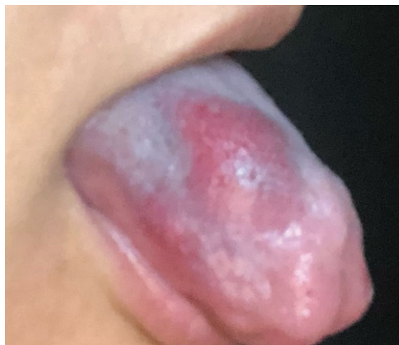
Figura 1 — Aspecto clínico na primeira consulta.

No momento da aplicação, procedeu-se à limpeza da área com clorexidina 0,12%; posteriormente, injetou-se no centro da lesão 0,4ml da solução esclerosante na proporção de 50%, diluída na solução anestésica local de lidocaína com adrenalina 1\100.000, com o auxílio de seringa de insulina. Em seguida, promoveu-se a vasoconstricção da área através da aplicação de gelo por 2 minutos. A paciente foi então orientada a retornar para reavaliação em 30 dias, considerando que ela residia no interior do estado. Não foi necessária uma segunda aplicação diante a completa resolução da lesão, caso que permaneceu até oito meses após a aplicação. A paciente relatou edema e desconforto de leve intensidade nas 48 horas subsequentes à aplicação, mas não foi necessário o controle medicamentoso.