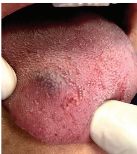
Figura 2 — Aspecto clínico nas 48 horas subsequentes à aplicação.