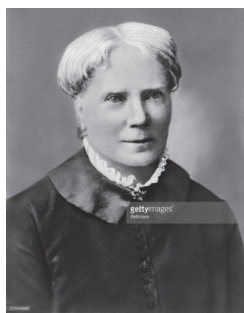
Elizabeth Blackwell (1821-1910) (1ª médica da América do Norte)