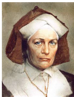
Hildegarda de Bingen (1098-1179) (1ª mulher a escrever um livro de medicina)