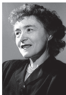
Gerty Cori (1896-1957) (1ª ganhadora do Nobel de Medicina)