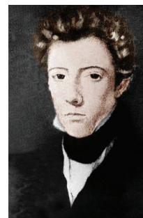
James Stuart Barry (1790-1865) (1ª médica inglesa)