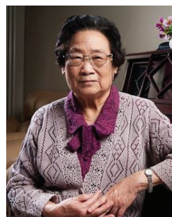
Tu YouYou (1930) (Ganhadora do Nobel de Medicina, 2015)