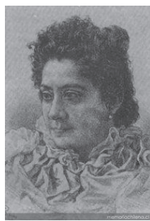
Eloisa Diaz Insunza (1866-1950) (1ª médica da América do Sul)