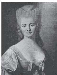
Dorothea Christiane Erxleben (1715-1762) (1ª mulher a se diplomar médica)