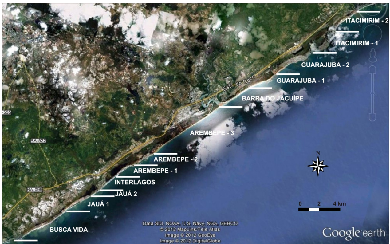
Figura 2. Segmentação utilizada para as praias do município de Camaçari.

Praia de Arembepe, trecho 1: caracterizada pela ocorrência de vegetação na pós-praia e no cordão-duna; presença de terraços arenosos, bancos de arenito e cordão-duna em menos de 50% do litoral; zona de surfe com até três linhas de arrebentação; presença de terras úmidas em mais de 50% do litoral; áreas com restinga e de desova de tartarugas marinhas; uso para pesca, mariscagem e plantações; ausência de locais com atratividade cênica natural e atratividade para atividades de ecoturismo.