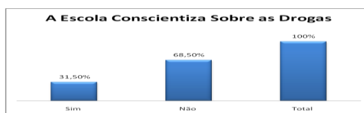
*Gráfico 02: A Escola Conscientiza Sobre as Drogas