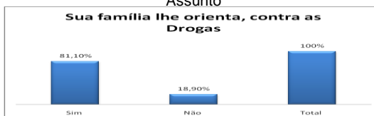
Gráfico 04: Sua família lhe orienta, contra as drogas