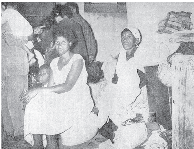
Figura 2 – Fotografias dos moradores da Favela do Canindé