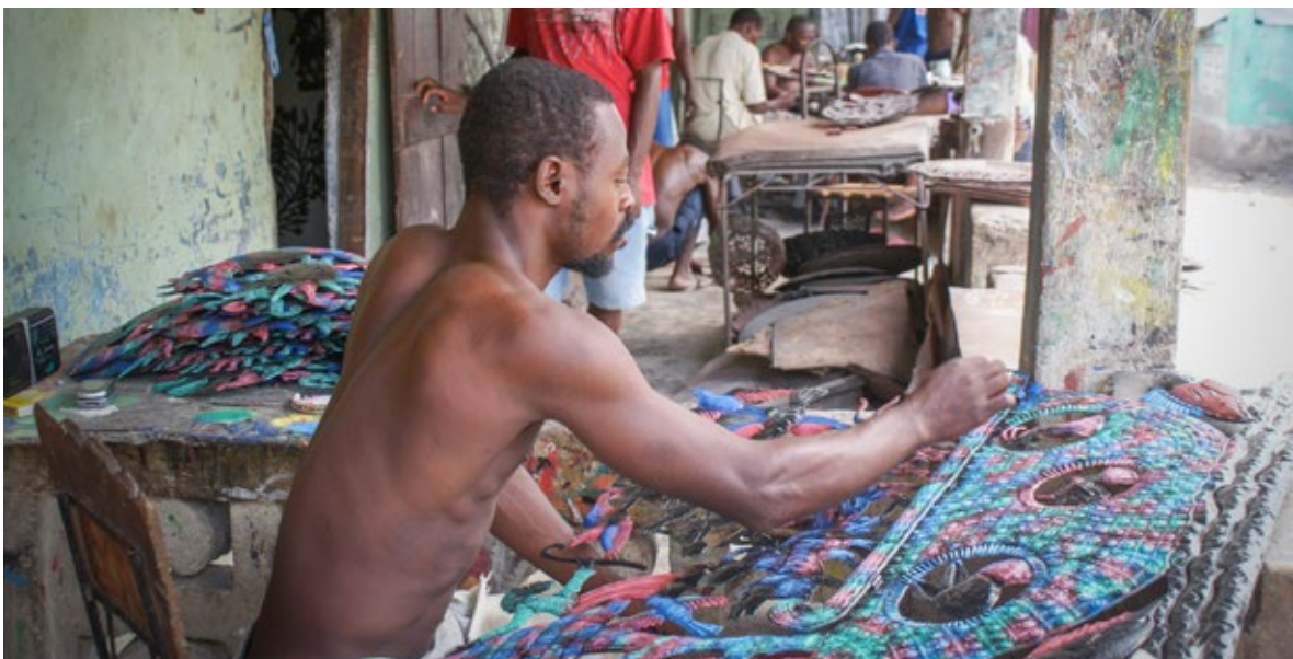
Ill. 7 Atelier du village de Noailles.