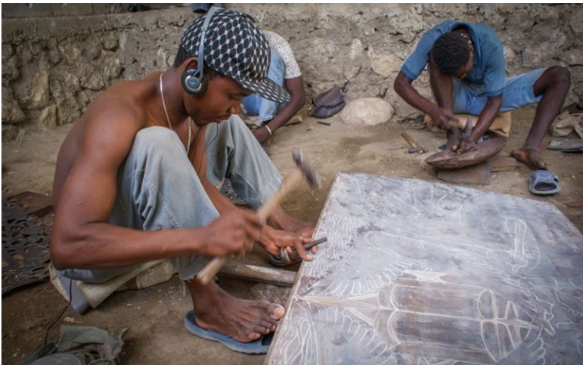
Ill. 6 Artisans de Noailles au travail.

électrique industriel implique que chaque objet de fer découpé sorti d'un atelier de Noailles soit unique. La technique rudimentaire constitue une garantie contre la production en série et un critère de qualité de l'exécution. De plus, elle est indissociable du métier de forgeron qui est non seulement à son origine, mais aussi la source de fabrication des outils de sculpteurs. Les Maîtres Bruno produisent dans leur forge autant d'outils agricoles que d'instruments indispensables aux sculpteurs du fer découpé. Selon la tradition orale familiale, ce précieux patrimoine culturel, à la fois physique et immatériel, appartient à la lignée depuis 1802. Témoin du passé exceptionnel, l'unique forge du village de Noailles à Croix-des-Bouquets est parmi les dernières du genre encore en activité dans la Caraïbe.