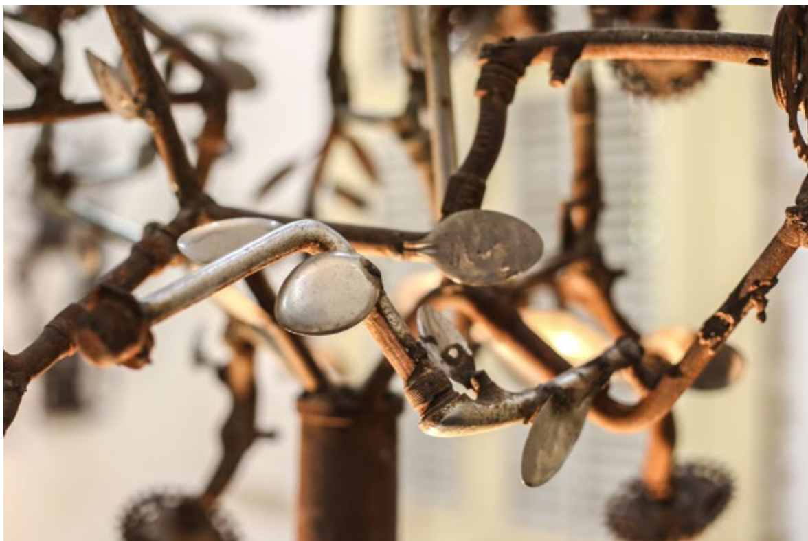
Ill. 3 Jose Delpe, Tree , 2005, sculpture en métal recyclé, 79 x 42 x 42 pouces, détail. Collection Musée Communautaire Georges Liautaud.

En outre, l'art du fer découpé à Noailles figure dans l'Inventaire du Patrimoine Immatériel d'Haïti (IPIMH) réalisé dans le cadre d'un partenariat ponctuel entre l'État haïtien et l'Université de Laval au Québec. 8 Il apparaît également sur la liste de soixante produits typiques réalisée par le Ministère du Commerce et de l'Industrie, en partenariat avec le Programme des Nations Unies pour le Développement (PNUD).