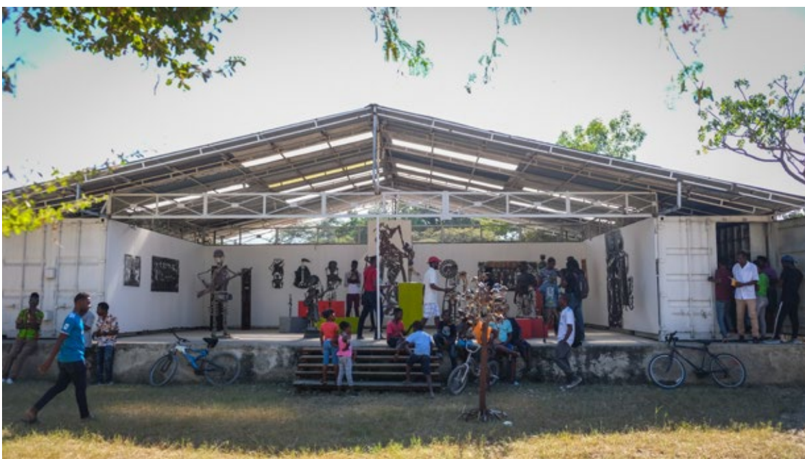
Ill 2. Musée Communautaire Georges Liataud.

Dans le cadre du projet d'aménagement du village, un comité de pilotage a été créé. Celui-ci regroupe en outre de l'Association des Artistes et Artisans de Croix-des-Bouquets (ADAAC), les leaders naturels du village, oungan, 6 pasteurs, associations de jeunes et les autorités locales. L'ADAAC, aux côtés du Comité de Pilotage, participe aux actions de promotion du village artistique de Noailles et de son art du fer découpé. Elle s'occupe des démarches qualifiantes telles que l'inscription sur la liste du patrimoine culturel immatériel de l'humanité (PCI).