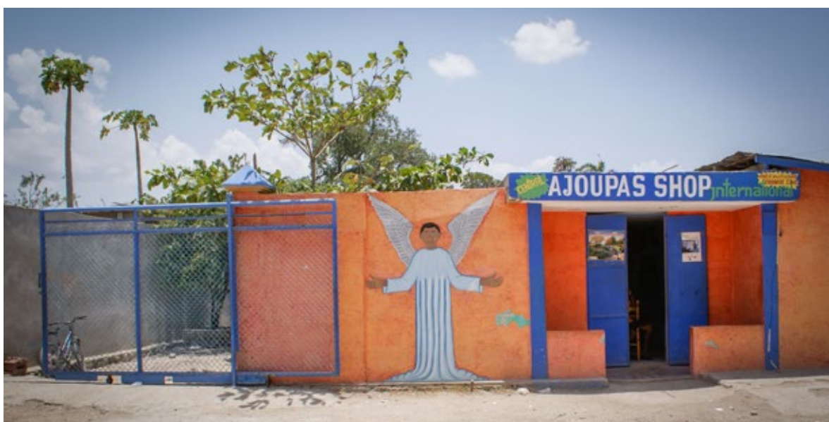
Ill. 5 Atelier Ajoupa.

La transmission de la tradition se perpétue grâce à un système coutumier d'apprentissage en atelier, permettant l'accueil pendant plusieurs années de jeunes des diverses régions du pays. L'absence de procédés mécaniques et d'outillage