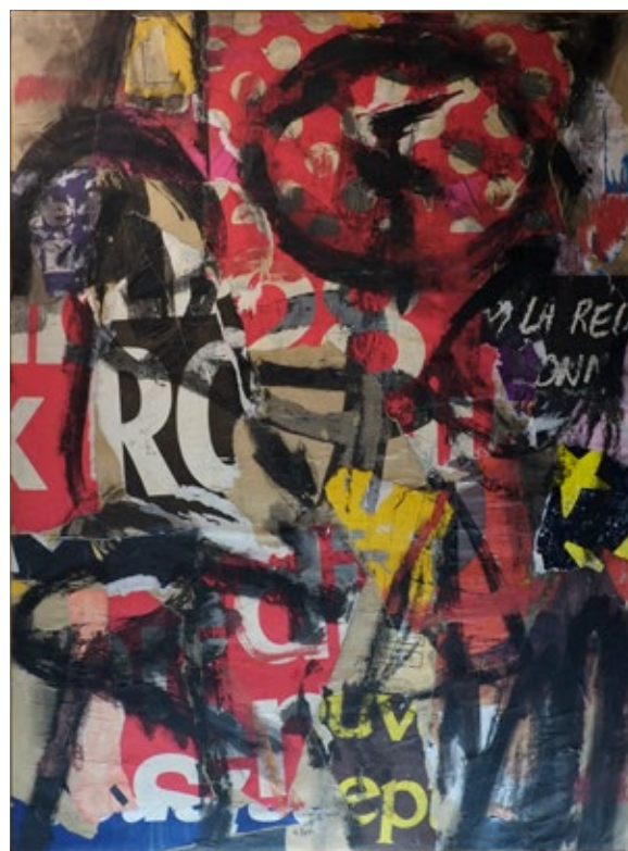
Peinture, 1965-1967, óleo sobre tela, 130 x 97 cm Collage Pintura, 1991, 130 x 97 cms.

Camadas (memória). Transparencia, Opacidade / Aparecendo, desaparecendo / Sobreescrita: interação / confrontação / emaranho (→ Memória) / Legibilidade