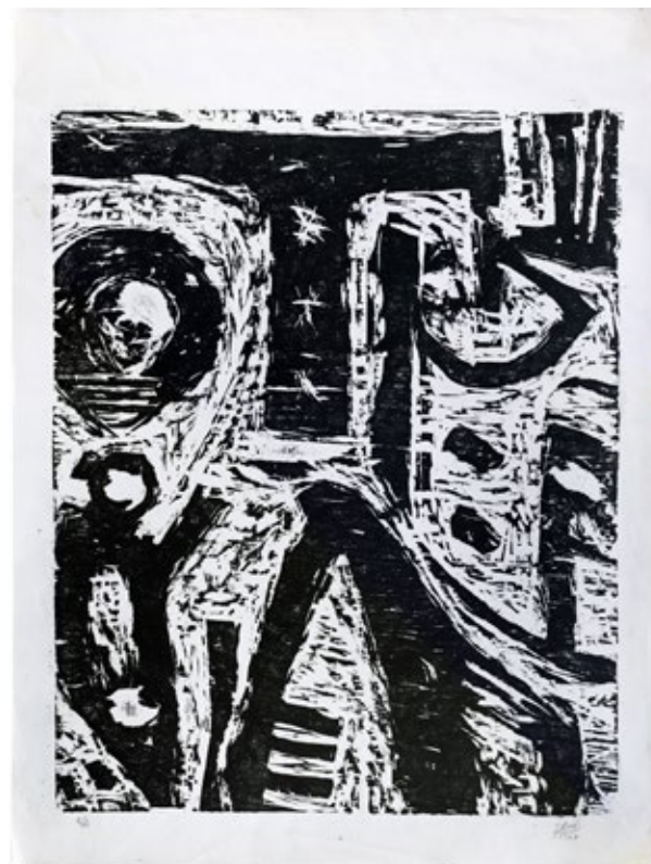
ST, 1977, xilogravura, E/A, 84 x 66 cm

O limiar – a matriz – evanesco / Memória / Fragilidade