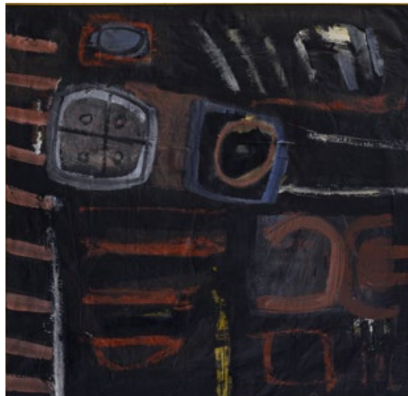
Pintura Negra, 1968-1970, óleo sobre tela, 115 x 120 cms Identidade.

Identidade. Primitivismo / As Demoiselles sacadas do marco.