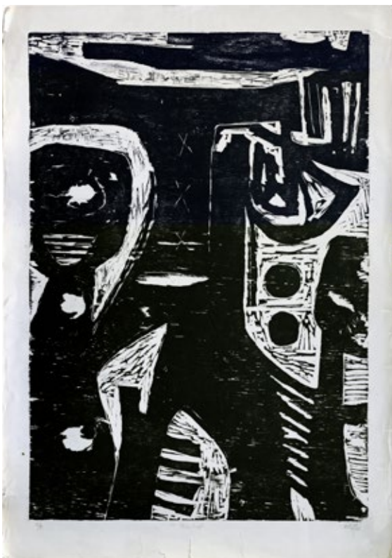
Umbral, 1977, 93 x 66 cms

Do arquivo do artista: Gandó Abakuá (Ekpe), dibujo copiado de Lydia Cabrera: Anaforuana. Madrid: Ediciones R, 1975: 87.