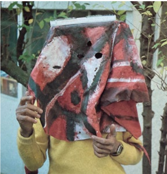
Ancestral. Para a exibição Máscaras de artistas, Salons Malmaison 1987.