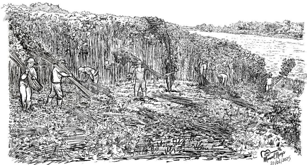
Figura 4 - Juticultores no corte das varas da malva na enchente

Fonte: Desenho gráfico de Manoel Nerys, 2025.