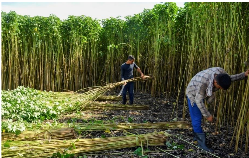
Figura 3 - Trabalhadores no processo de extração da juta/malva na Ilha do Marrecão

No locus do labor cotidiano, o som do seu instrumento de trabalho, ao cortar a malva, se mistura aos cantos dos pássaros e do vento nas plantações, compondo uma melodia rítmica única e poética, como uma canção que transmite tranquilidade, transparecendo ser a relação perfeita entre homem e natureza. Porém, esse olhar romântico, fixado somente no cenário estético e estático da paisagem, impossibilita o desvelar de seus múltiplos significados.