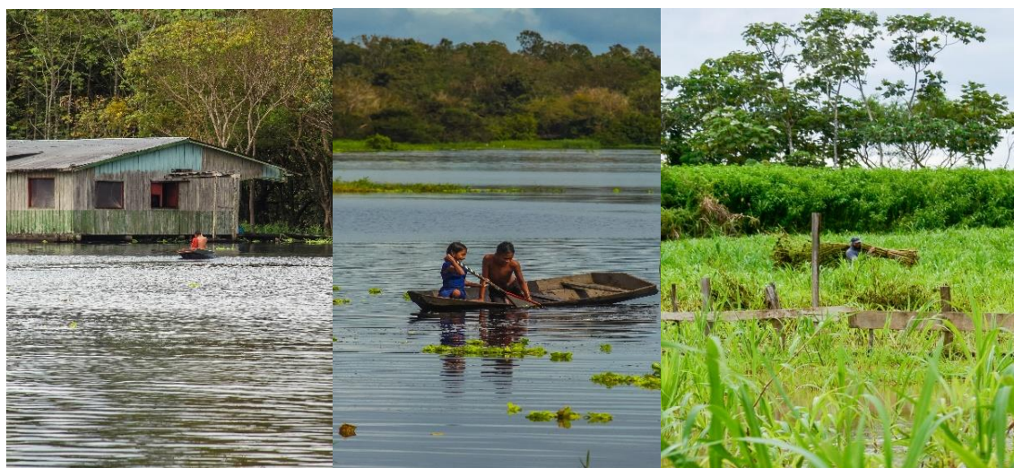
Figura 2 - Registros das paisagens da Ilha do Marrecão

O lar dos moradores da ilha foi se formando ao longo do tempo e em seguida seus habitantes foram chegando, adquirindo pertencimento e dando significado ao lugar. É nesse cenário que os juticultores da comunidade da Ilha do Marrecão, por meio de suas narrativas, expressam sua visão de mundo no ambiente das águas. O juticultor namorador das águas, é visto como contador de histórias, aventureiro, poeta, devaneiro, bubeieiro, carrega marcas e semblantes que transcendem sua própria vida. Suas relações com as águas são profundas desde os mergulhos nos rios e lagos da infância.