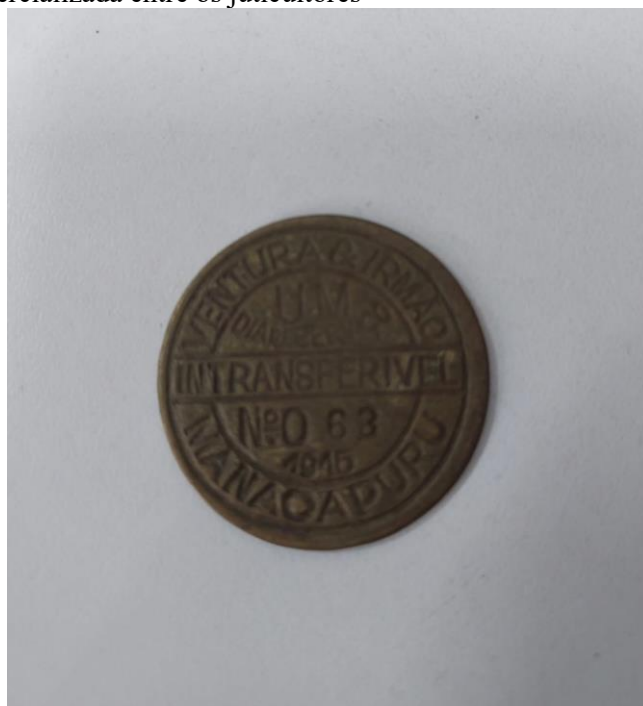
Figura 5 - Moeda comercializada entre os juticultores

O controle sobre a força de trabalho também se manifestava na criação de uma moeda exclusiva dos Ventura, cunhada em Portugal, equivalente a um dia de serviço. O senhor Geraldo Costa, em entrevista de 2025, relata: “Eles mandaram fazer essa moeda em Portugal, ela tinha o valor de um dia de trabalho, eles davam para o trabalhador poder comprar com eles no comércio deles. Só tinha validade para quem trabalhava pra eles.” Como se pode observar na Figura 5, a moeda trazia gravadas as inscrições “Manacapuru”, “Família Ventura” e a palavra “intransferível” ao centro, simbolizando o monopólio econômico sobre os trabalhadores da juta.